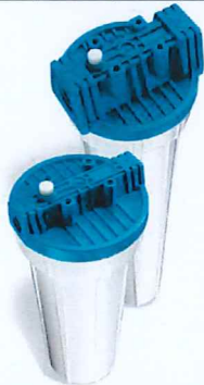
Contenitore per cartucce serie FP2 standard testa inserto ottone vaso opaco bianco FP2 filter cartridge housings with brass inserts and opaque white sump