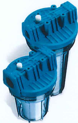
Contenitore per cartucce serie FP2 standard testa senza inserto ottone vaso SAN trasparente FP2 filter cartridge housing without brass inserts and transparent SAN sump